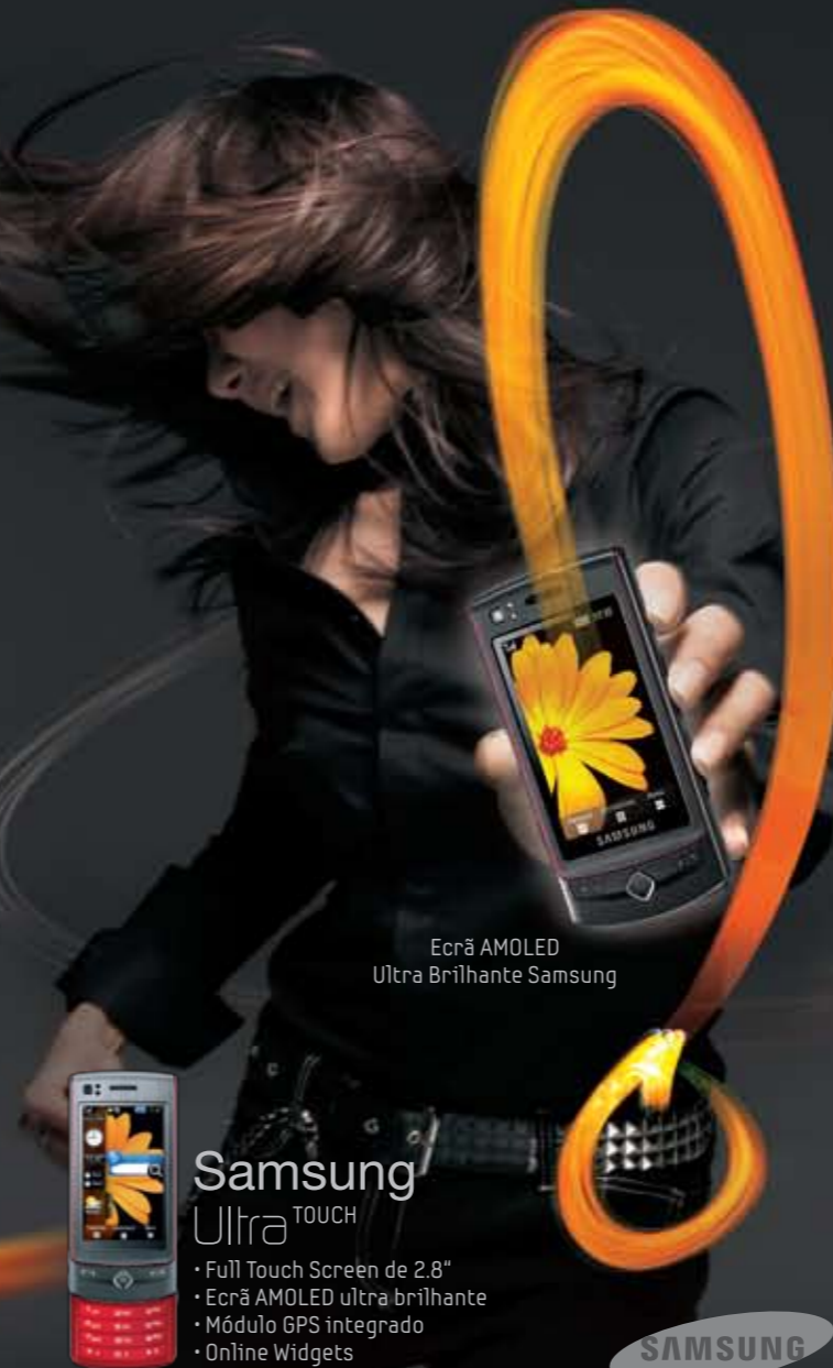
Ecrã AMOLED Ultra Brilhante Samsung

Todos os direitos reservados. As especificações apresentadas estão sujeitas a alterações sem aviso prévio. A disponibilidade de determinados produtos e serviços pode variar de região para região. Consulte por favor o representante Samsung mais próximo de si.